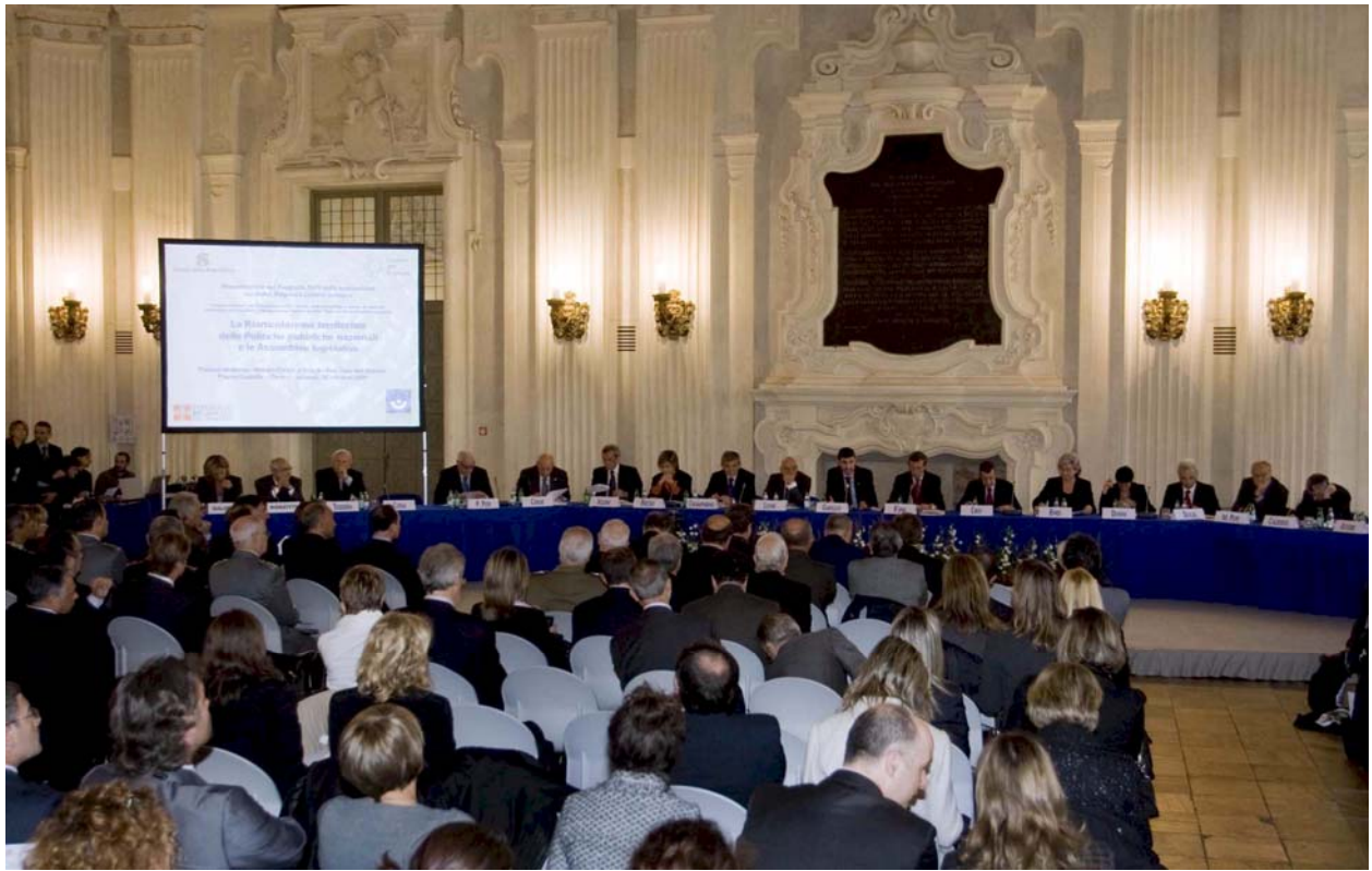
PRESENTAZIONE DEL RAPPORTO SULLO STATO DELLA LEGISLAZIONE – TORINO, 30 OTTOBRE