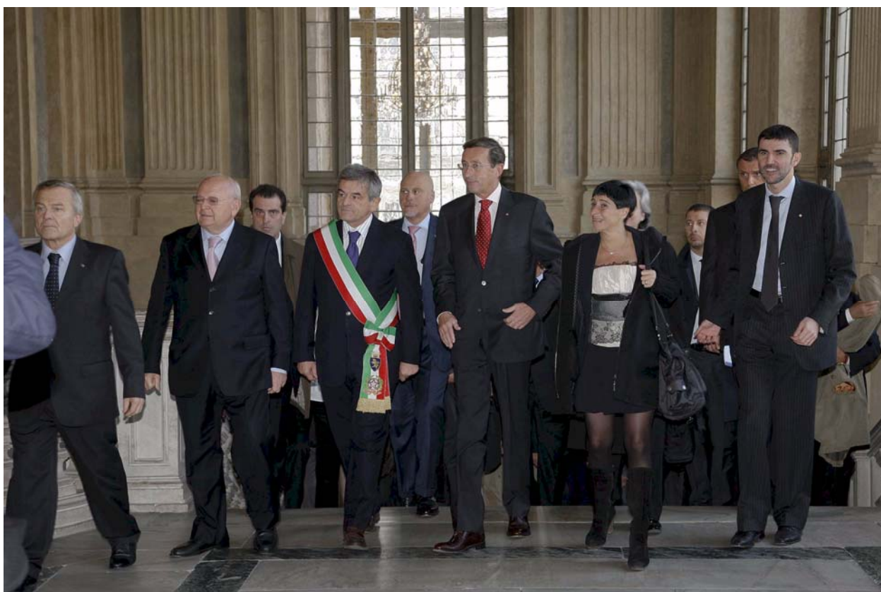
PRESENTAZIONE DEL RAPPORTO SULLO STATO DELLA LEGISLAZIONE – TORINO, 30 OTTOBRE