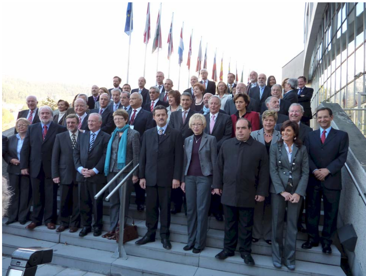
XI ASSEMBLEA DELLA CALRE – INNSBRUCK, 19 E 20 OTTOBRE