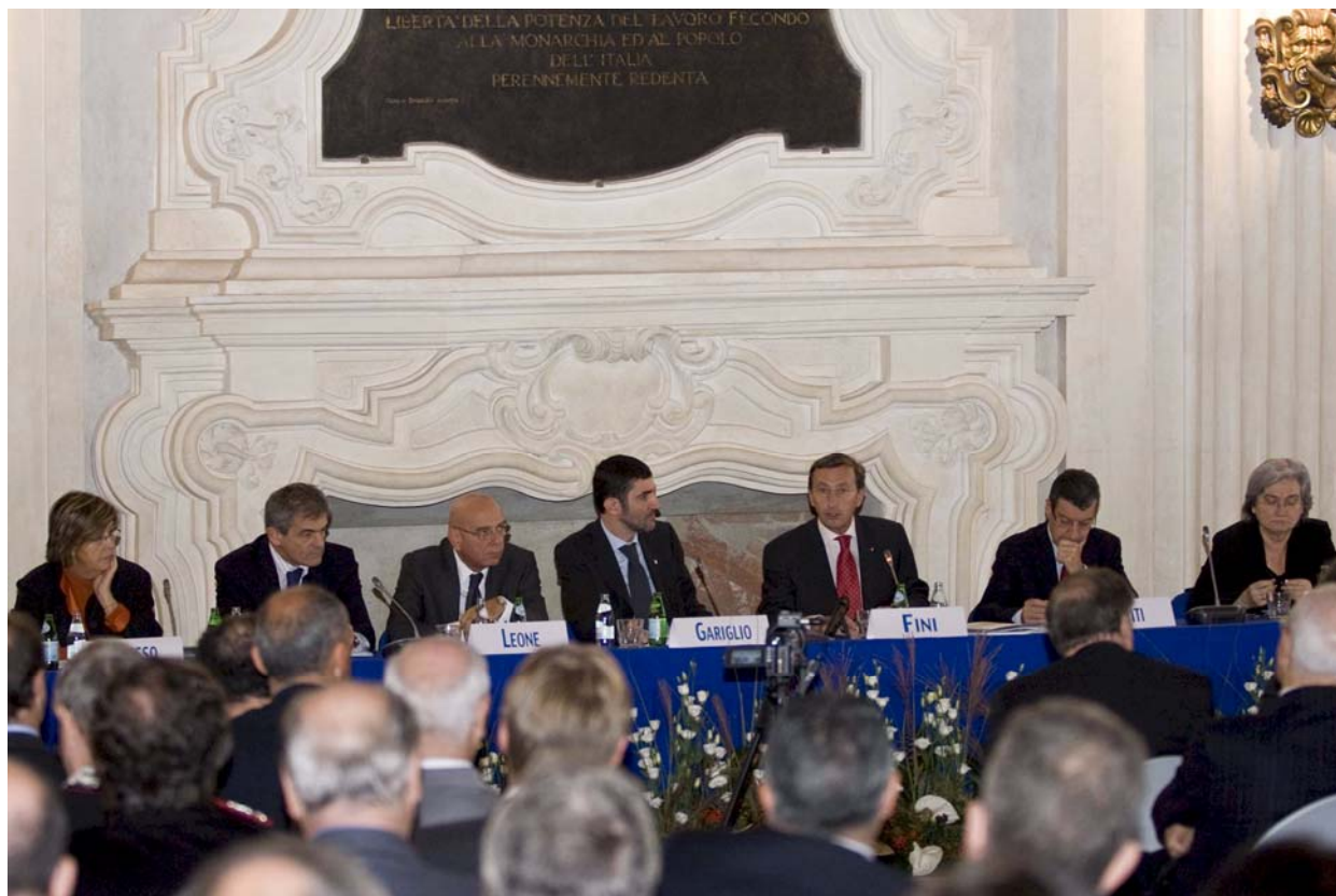
PRESENTAZIONE DEL RAPPORTO SULLO STATO DELLA LEGISLAZIONE – TORINO, 30 OTTOBRE