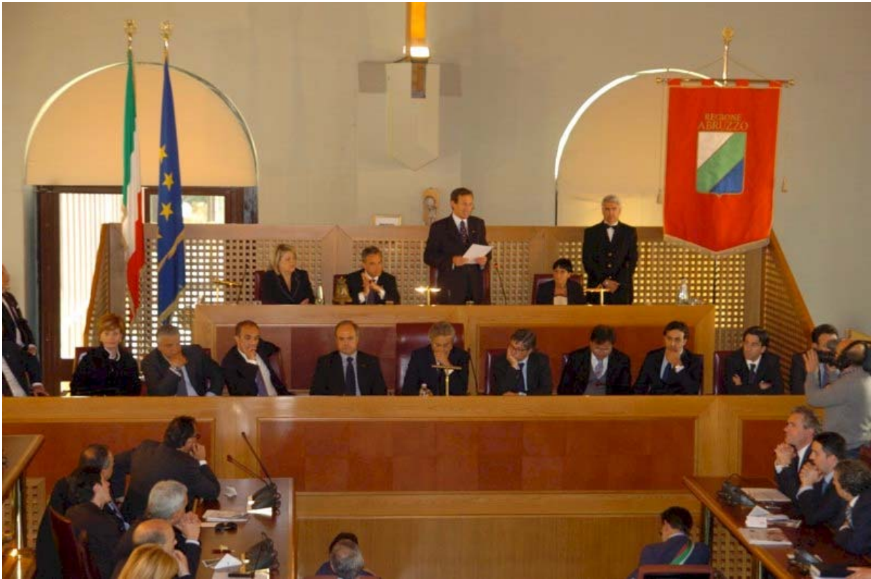
SEDUTA SOLENNE DEL CONSIGLIO REGIONALE DELL'ABRUZZO – L'AQUILA, 6 MAGGIO